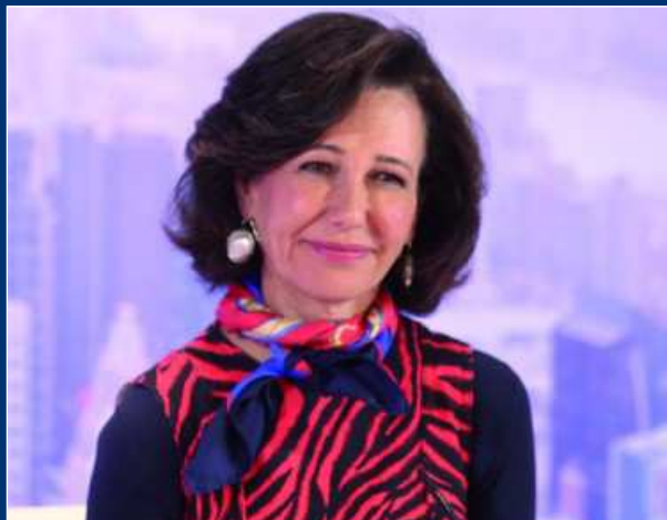
ANA BOTÍN. Presidenta de Banco Santander