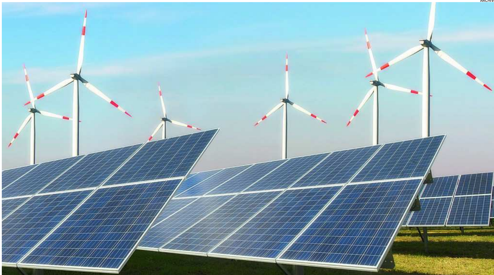
El objetivo del Gobierno es duplicar en 2030 la energía eléctrica procedente de fuentes renovables

aprobó la Política Ambiental, Energética y de Cambio Climático del Grupo Unicaja Banco para establecer los principios básicos de actuación en materia medioambiental y de eficiencia energética. Asimismo, ha creado la Escuela de Finanzas Sostenibles en su campus virtual con el propósito de albergar los recursos formativos e informativos que se generen sobre esta materia.